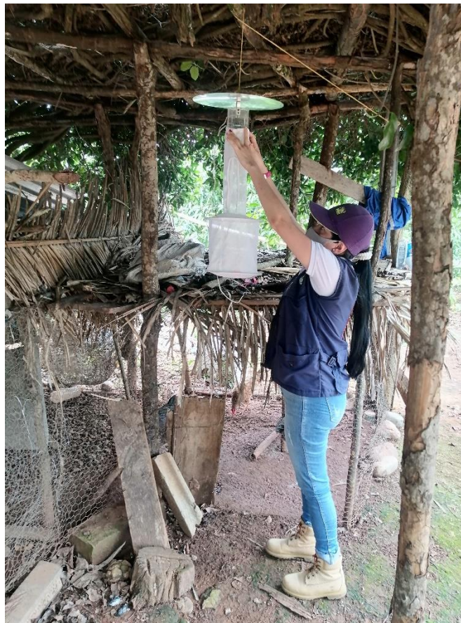
Imagen Evaluación entomológica Leishmaniasis Visceral en el Municipio de Ortega Vereda Chicuambe

Durante el presente año se atendió el foco presentado en el municipio de Ortega, realizando búsqueda activa de casos leishmaniasis visceral, a través de Tamizaje serológicos en niños menores de 15 años, arrojando 100% NEGATIVOS, también se