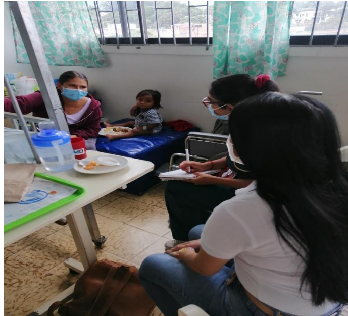
Entrevista e IEC a madre del caso de Leishmaniasis Visceral-Ortega